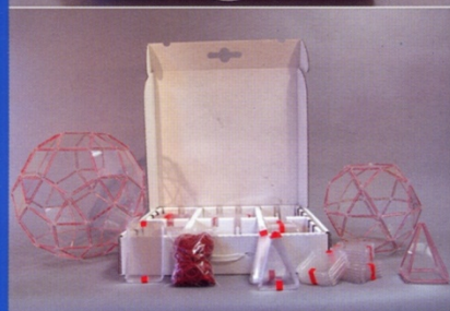
Klassensatz es01 , bestehend aus: 100 gleichseitige Dreiecke, 60 Quadrate, 36 Fünfecke, 60 gleichschenklige Dreiecke, 30 Rechtecke, ca. 600 Gummiringe