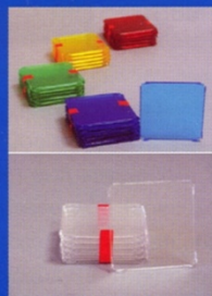
Quadrate in gelb, blau, rot, grün und glasklar, 1 Pck. jeweils 10 St.