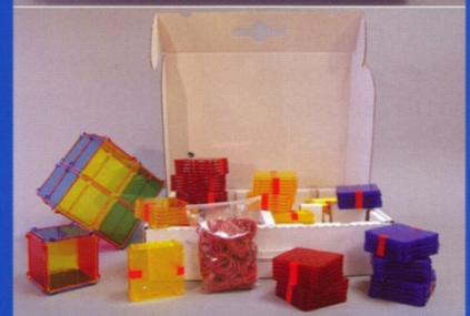
Würfelsatz es03 , bestehend aus: 70 Quadrate, gelb; 70 Quadrate, rot; 70 Quadrate, blau; ca. 500 Gummiringe