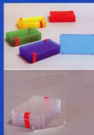
Rechtecke in gelb, blau, rot, grün und glasklar, 1 Pck. jeweils 10 St.