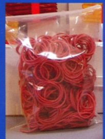
Satz Gummiringe , 500 g.

BESTELLSCHHEIN Bei Bestellungen mit diesem Schein erhalten Sie innerhalb von 2 Jahren einen Rabatt von 10% auf alle Preise.