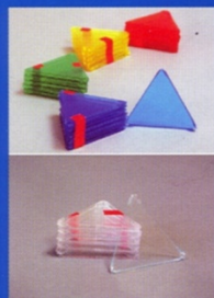
Gleichseitige Dreiecke in gelb, blau, rot, grün und glasklar, 1 Pck. jeweils 10 St.