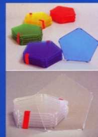
Fünfecke in gelb, blau, rot, grün und glasklar, 1 Pck. jeweils 12 St.